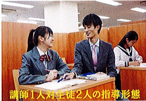
講師1人对生徒2人の指導形態

(城南コベッツ国府宮教室の特長) 成績別に指導教材を5段階に分けていますので、安心してお任せ下さい！