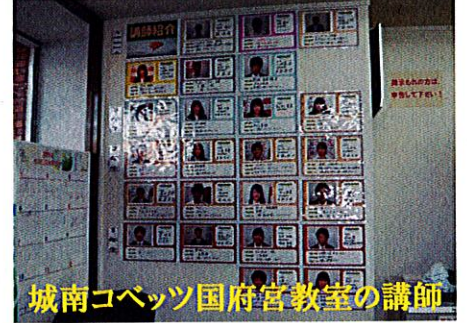
城南コベッツ国府宮教室の講師

当教室では、一定以上の学力を有する講師21名が在籍しています。必ず皆さんと相性の良い講師が見つかるでしょう。担任制で指導しますので、お子さんの弱点を把握して、次の定期テストの試験範囲で苦手な箇所をピンポイントで指導します。このため、非常に成績アップしやすい指導体制になっています。